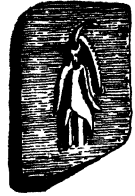
राजसी गगवेश में एक मन्त्री

[टिप्पणियाँ देखिये, परिशिष्ट २, पृष्ठ २३]